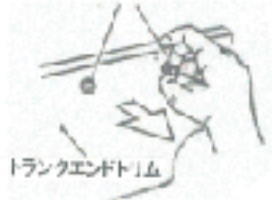
トランクエンドリム